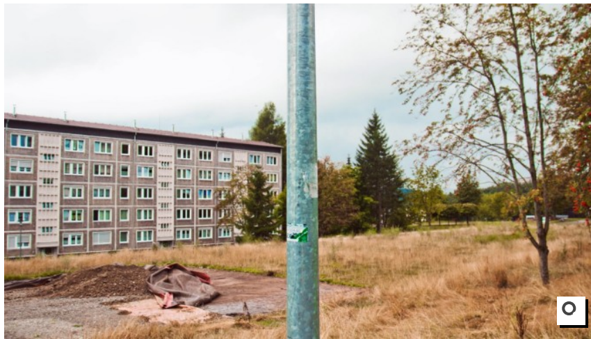
Aufnahmen aus dem Wohngebiet in Suhl, aufgenommen im September 2014

Was wäre, wenn die Bundesländer eigene Staaten wären? Die Zahlen zur Wirtschaftskraft der Länder bergen überraschende Erkenntnisse.